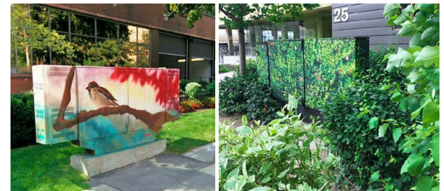
Projet d'embellissement des abris d'équipement de Bell dans la région du Grand Toronto.

Bell organise une campagne qui vise à embellir la région du Grand Toronto en transformant les abris d'équipement téléphonique situés dans les collectivités. Le projet d'embellissement des abris d'équipement de Bell repose sur une collaboration novatrice entre des organismes artistiques communautaires, des artistes locaux, des associations de citoyens et des gouvernements locaux. Le projet permet de dissuader les gens de faire des graffitis en créant des œuvres d'art originales qui enrichissent le paysage urbain des quartiers. Il offre l'occasion à des artistes locaux d'exprimer leur talent. Depuis 2009, plus de 300 abris d'équipement téléphonique de Bell ont été peints aux quatre coins de Toronto.