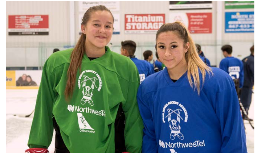
Northwestel Summit Hockey School au Yukon.