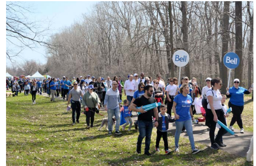
La marche annuelle de collecte de fonds Faites un pas vers les jeunes, organisée à Montréal et ailleurs au pays.

Depuis le début de cette activité en 2002, les membres de l'équipe Bell ont amassé plus de 10,9 millions $