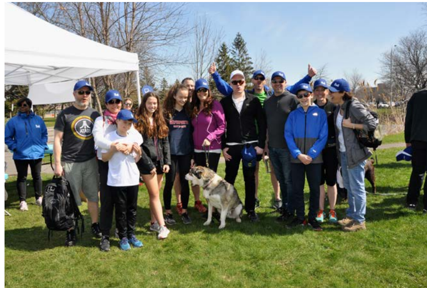
Au total, notre équipe a accompli plus de 210 000 heures de bénévolat afin de bâtir des collectivités plus fortes.

Dans le cadre du Programme de dons des employés, les membres de l'équipe et les retraités de Bell ont fait des dons totalisant 2,6 millions $ en 2018. Au total, notre équipe a accompli plus de 210 000 heures de bénévolat afin de bâtir des collectivités plus fortes grâce à leur appui à des organismes sportifs et caritatifs. Parmi les nombreuses activités auxquelles ils participent tout au long de l'année, les bénévoles de Bell construisent des maisons, préparent des colis de réconfort, nettoient des centres communautaires, amassent des fonds et recueillent des jouets et des fournitures scolaires destinées aux enfants.