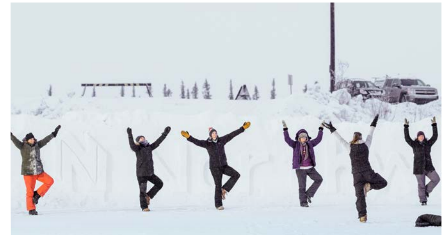
Yoga au clair de lune au village de glace de Northwestel.

Au mois de décembre, le soleil se couche pour la dernière fois à l'horizon et, après près de trente jours de noirceur, on célèbre, chaque année, son retour lors du Sunrise Festival d'Inuvik. En 2019, Northwestel a parrainé le village de glace Sunrise, qui, selon les estimations, a reçu la visite de plus de 3 000 personnes qui ont traversé le delta du Mackenzie, et d'autres, venues d'encore plus loin pour participer à toute la gamme d'activités familiales qui ont eu lieu pendant trois jours. Le village de glace Northwestel était situé sur les lacs Twin Lakes et on y a présenté du patinage artistique et de la sculpture sur neige, ainsi que des spectacles musicaux et artistiques sur scène, en plus d'offrir aux participants l'occasion de faire des glissades. Le thème du festival de 2019 était de relier les collectivités, car le fleuve Mackenzie en relie plusieurs et Inuvik joue le rôle de carrefour au milieu de la route de glace. Les festivités comprenaient des dégustations de plats locaux, des spectacles de danse et de musique et des activités d'hiver, dont de la sculpture sur neige, du yoga au clair de lune et du baseball d'hiver.